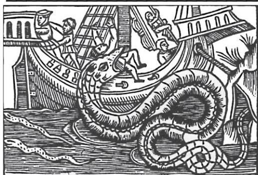
Uma serpente do mar, de Olaus Magnus, livro História dos Povos do Norte (1555).

c) Por que as cartas com as novas rotas marítimas eram sigilosas e guardadas?