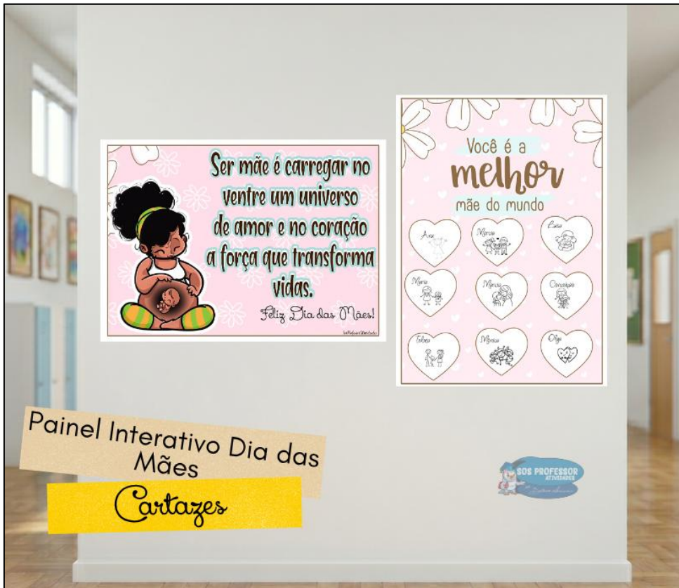
Painel Interativo Dia das Mães Cartazes