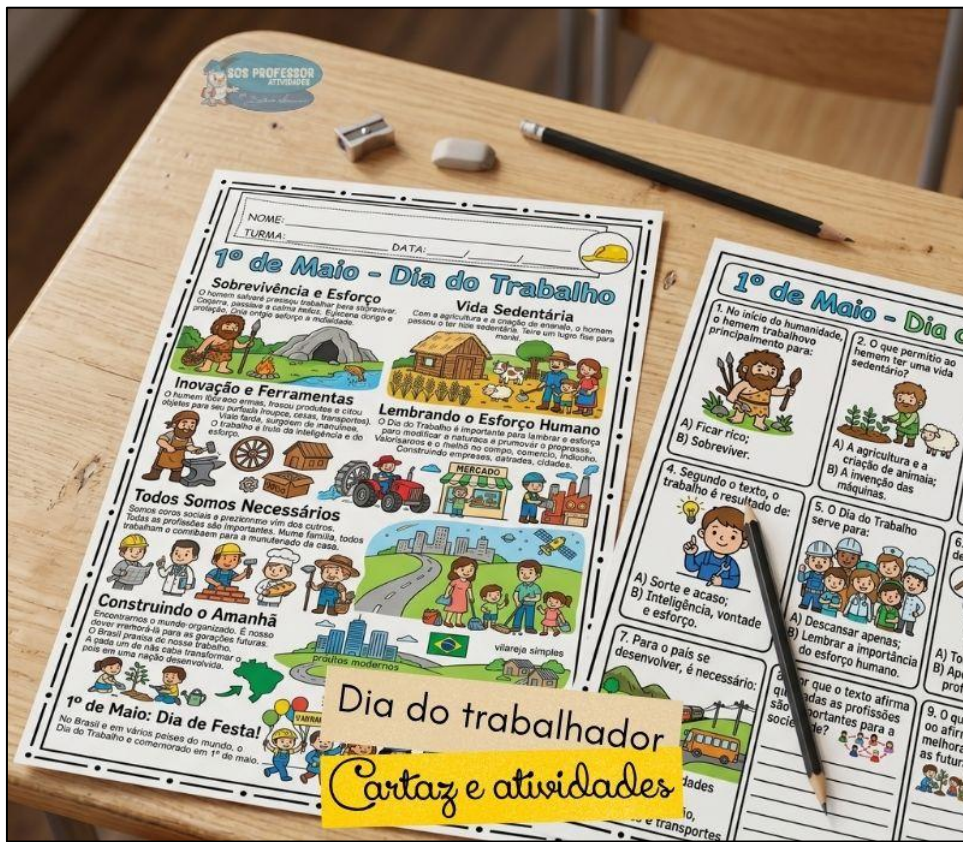
Cartaz e atividades